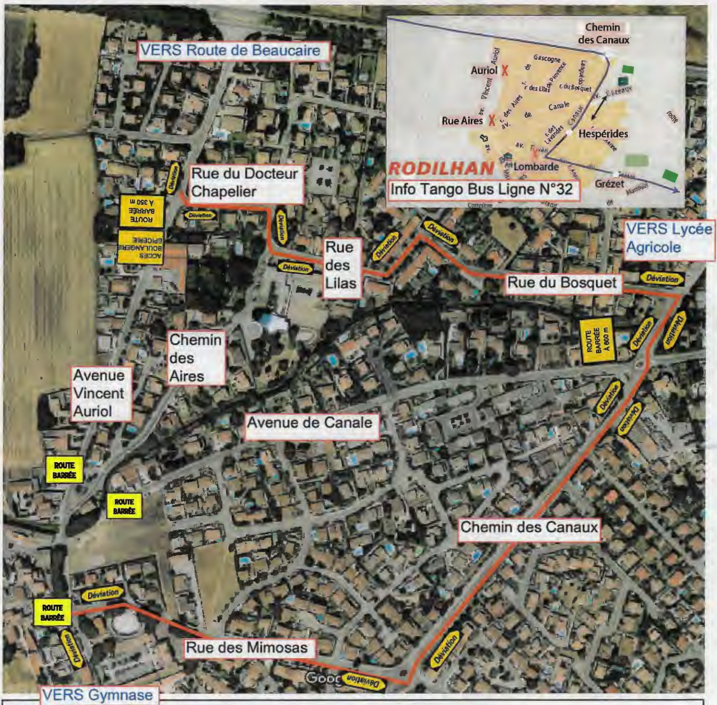
Plan de déviation commune de Rodilhan

ACCES BOULANGERIE & EPICERIE PAR AV. VINCENT AURIOL et CH. DES AIRES