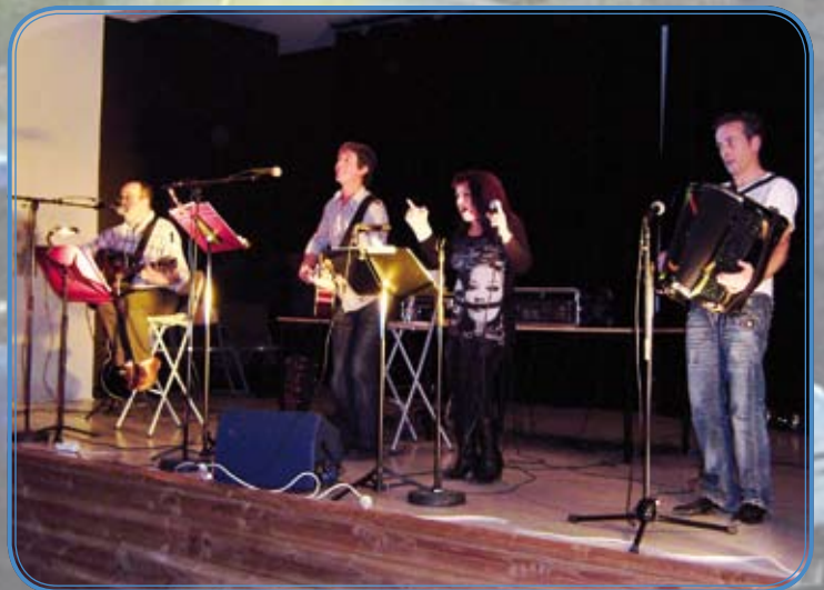
Sans les Nommer en concert