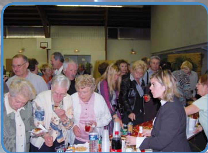
Soirée des associations