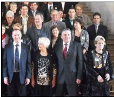
Les représentants de Rodilhan sur les marches du Sénat, au premier plan les sénateurs du Gard, de g à d : Simon Sutour, Françoise Laurent-Perrigot, Jean-Paul Fournier

A l'issue du goûter préparé par les services communaux la classe rejoint l'école où les travaux d'éducation civique se poursuivront.