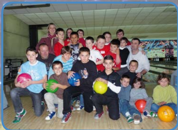
Les jeunes du Football Club