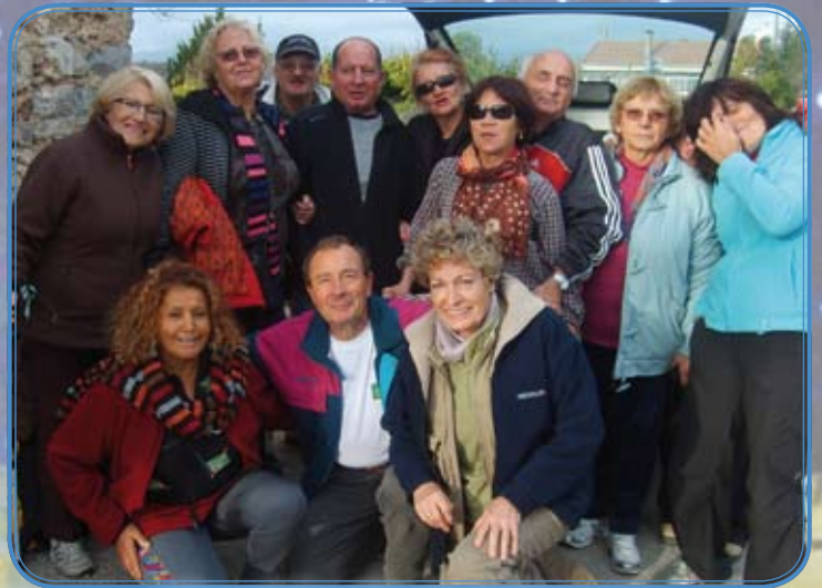
Association «Les Amis Sympas»