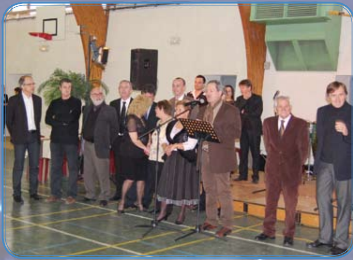
Repas des aînés