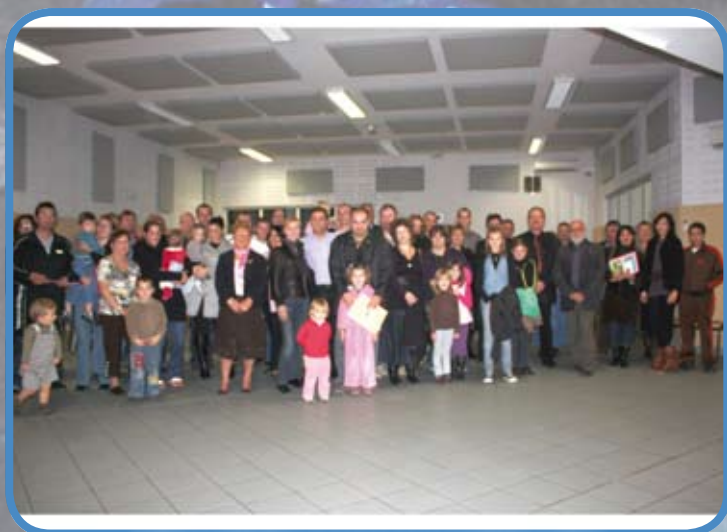
Accueil des nouveaux rodilhanais