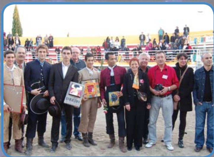
Féria de l'Ultim : organisateurs et toreros