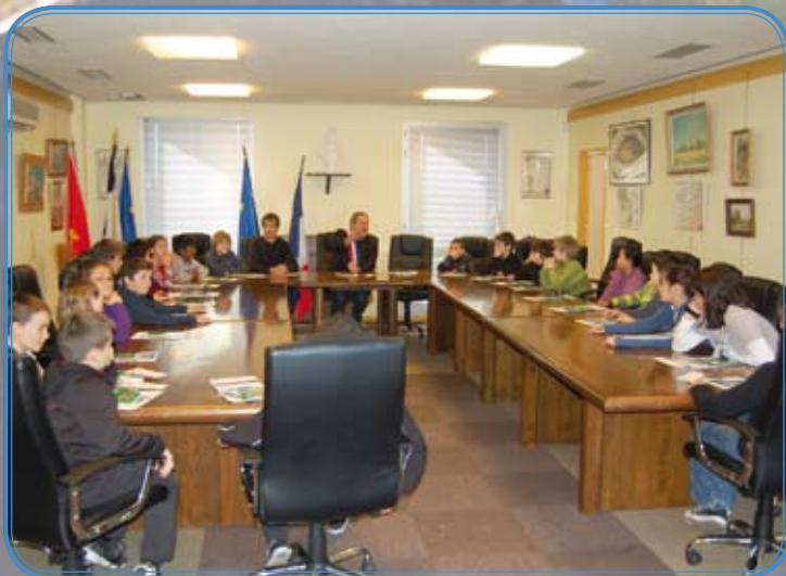
Les CM2 reçus à la mairie